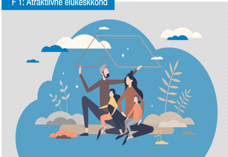
F 1: Atraktiivne elukeskkond