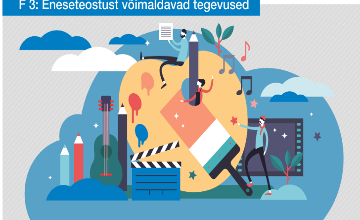
F 3: Eneseteostust võimaldavad tegevused